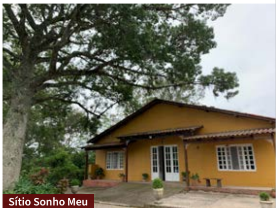
Sítio Sonho Meu

No local, não é permitido fumar nem levar bebidas alcoólicas, e o almoço é vegetariano. O espaço conta com trilha, cachoeira, área de piquenique e área coberta para descanso. (\$) A visita ocorre sextas e sábados, das 9h até o pôr do sol. O valor da entrada por pessoa é de R$ 20.