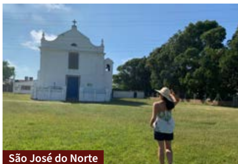
São José do Norte