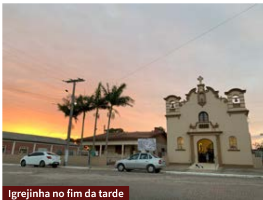
Igrejinha no fim da tarde