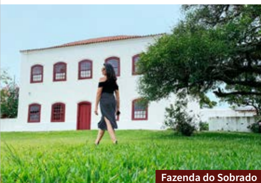
Fazenda do Sobrado

› Hotel das Figueiras: Com vista privilegiada para a Praia das Nereidas,tem área com piscina e ampla sala de café da manhã, com televisão e espaço para tomar chimarrão. Informações e reservas aqui