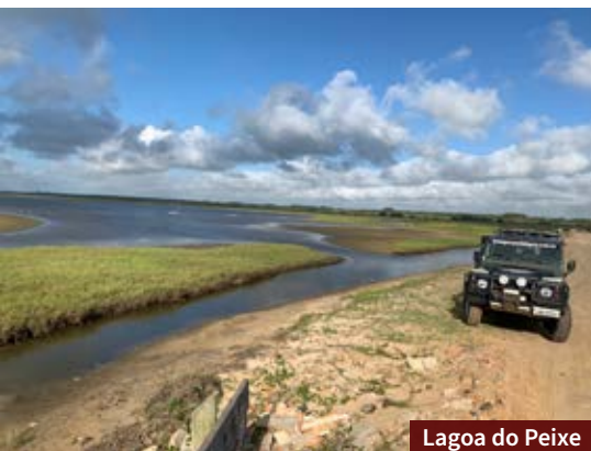
Lagoa do Peixe

A Lagoa Expedições e Turismo realiza passeios de Jeep pela Lagoa do Peixe e Lagoa dos Patos. Os passeios são personalizáveis e podem durar até 7h.