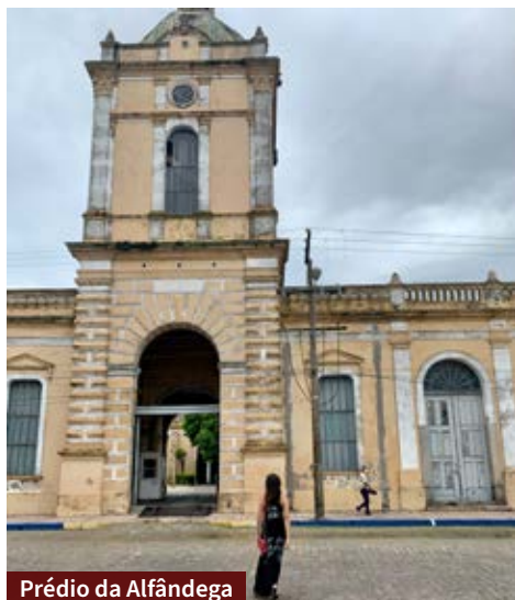
Prédio da Alfândega

Atualmente fechado em virtude da pandemia, o Navio Museu fica no porto velho, bem próximo ao centro, e merece uma visita. Atualmente, ele recebe apenas pequenas embarcações e há uma área com ciclovias. Nos