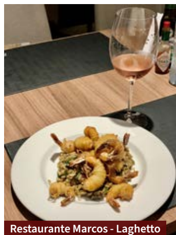
Restaurante Marcos - Laghetto