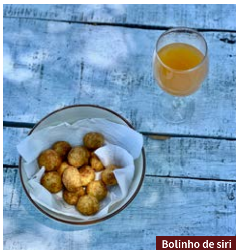
Bolinho de siri