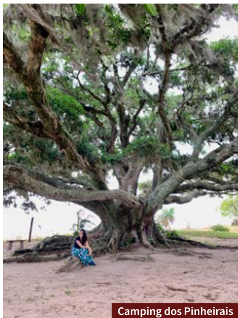
Camping dos Pinheiros

Para quem deseja conhecer ou até mesmo fazer um passeio de barco, o Clube Náutico Tapense reúne várias embarcações que vêm de outras cidades do Estado.