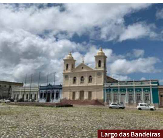
Largo das Bandeiras

Construída entre 1880 e 1883 com o objetivo de atender os oficiais e praças do exército, a antiga Enfermaria Militar fica no Cerro da Pólvora, ponto mais elevado da cidade. O prédio será restaurado e ali será instalado o Centro de Interpretação do Pampa, espécie de museu e complexo cultural ligado à Universidade Federal do Pampa.