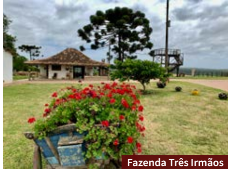
Fazenda Três Irmãos