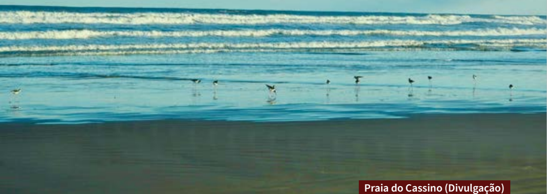
Praia do Cassino

No extremo sul do Rio Grande do Sul, a cidade de Rio Grande é um importante reduto para a economia gaúcha devido à área portuária. No entanto, o setor turístico também tem muita força, e a natureza e a história são protagonistas. A praia do Cassino, a Capilha e o Taim são exemplos de lugares lindos do roteiro, que merece ao menos dois dias.