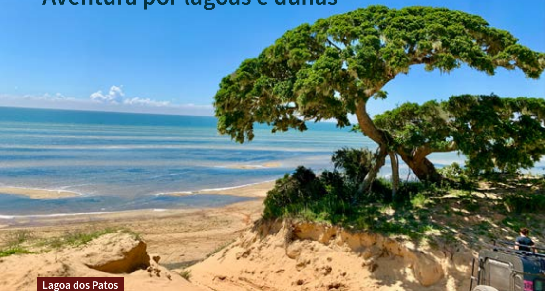
Lagoa dos Patos

D estino para quem busca contato com a natureza, Tavares é uma verdadeira joia da Costa Doce Gaúcha. A 230km de Porto Alegre, a cidade fica dentro do Parque Nacional da Lagoa do Peixe, o que faz da viagem uma experiência incrível e diferente.