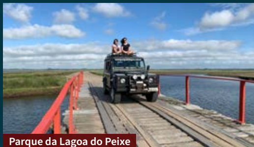
Parque da Lagoa do Peixe

Tavares é um destino que une aventura e muita natureza. Por isso, para alguns passeios você vai precisar de veículo 4x4, devido ao solo arenoso e aos trajetos no meio da água. Caso você não tenha ou não consiga alugar, a agência receptiva faz os passeios.