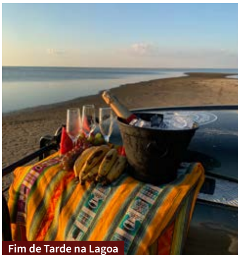
Fim de Tarde na Lagoa