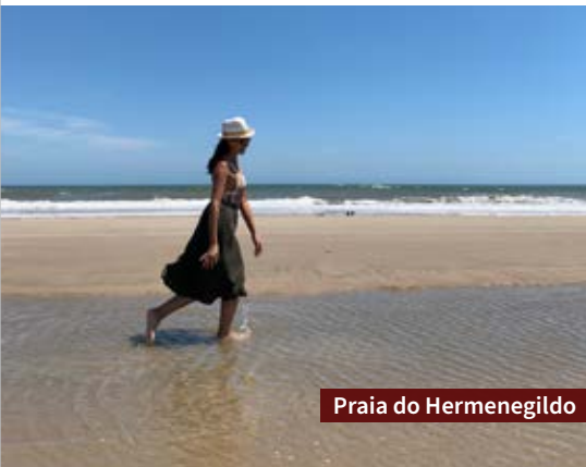
Praia do Hermenegildo

Se quiser agendar passeios, o MerguLeão Turismo tem opções - informações: (54) 99653-3434. Também atendem a região Neto Agência de Viagens - informações: (51) 3737-8084 - e a Costa Sur Turismo - informações (53) 98114-8184