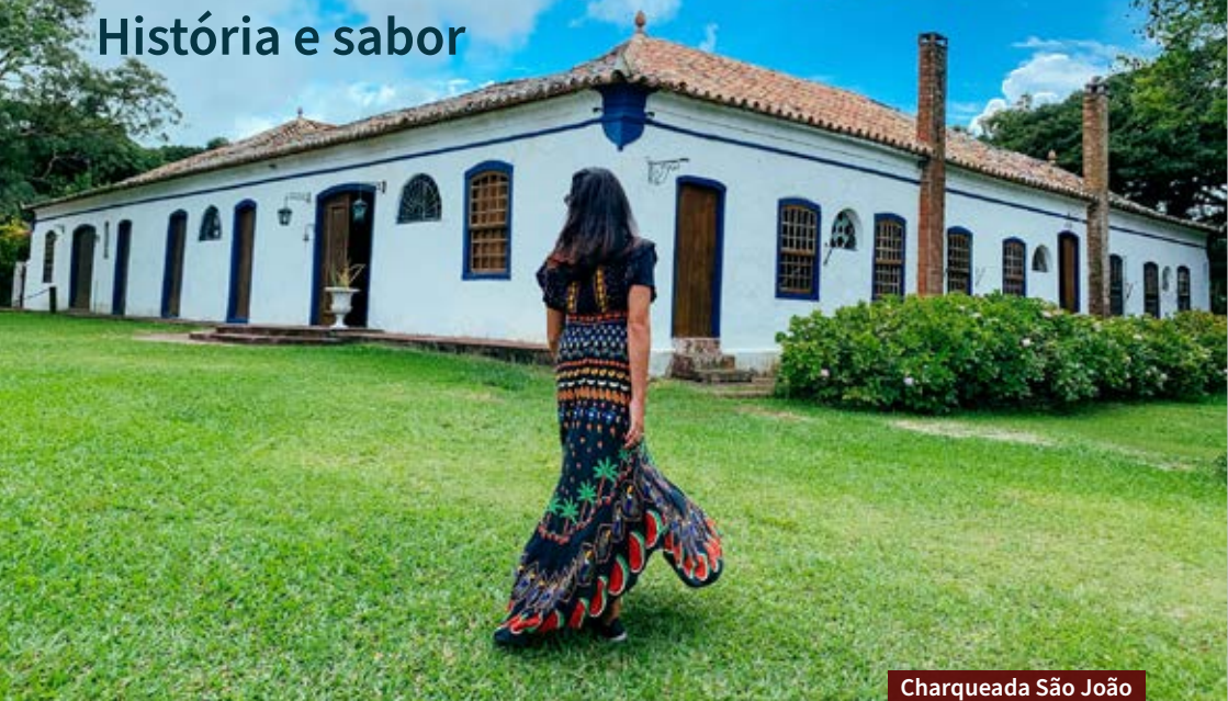
Charqueada São João

P ara quem gosta de destinos completos, Pelotas merece alguns dias de roteiro. Um dos pontos altos está na parte histórica da cidade, que viveu uma época áurea com a indústria do charque, principal economia no século 19. Por conta disso, as charqueadas são um dos principais atrativos e preservam tradições.