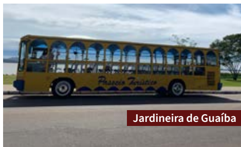
Jardineira de Guaíba

($) O ingresso é pago e as visitas devem ser agendadas.