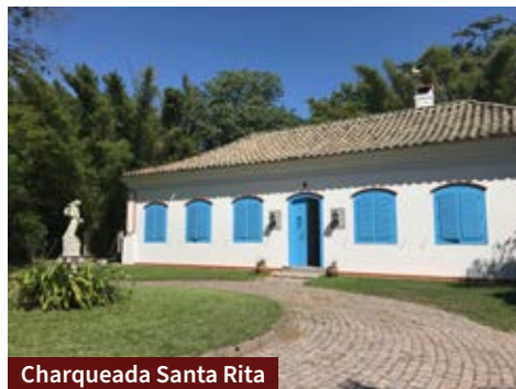
Charqueada Santa Rita

Ao chegar na Charqueada Boa Vista o imenso jardim chama a atenção. O empreendimento