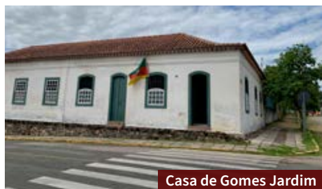
Casa de Gomes Jardim