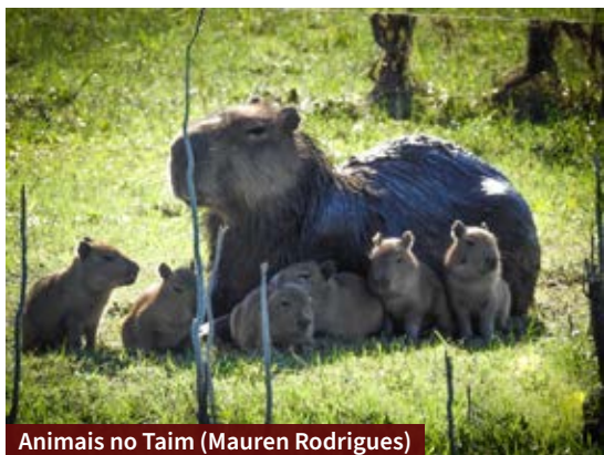
Animais no Taim (Mauren Rodrigues)