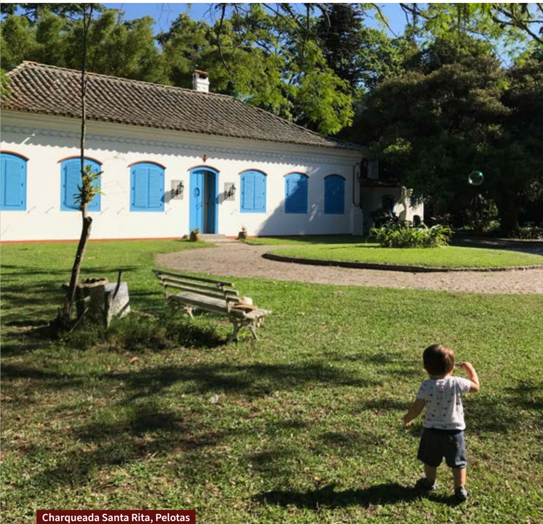
Charqueada Santa Rita, Pelotas