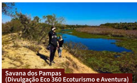
Savana dos Pampas

nas principais praias, como a da Costa Doce e a do Caramuru. Além dos espaços para relaxar e caminhar, há pontos para fazer churrasco.