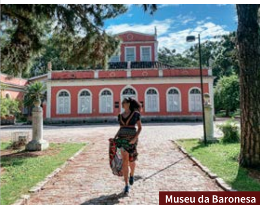
Museu da Baronesa

Os doces de Pelotas fazem parte da história e da tradição da cidade que tem forte influência portuguesa. Por isso, é quase obrigatório experimentar algum dos diversos doces que os pelotenses produzem. Entre os principais estão os docinhos à base de ovos, como quindim e ninhos. Indicamos alguns lugares para você experimentar: Confeitaria Berola , Doçaria Monalu , Imperatriz Doces Finos e Trufas Meuy .