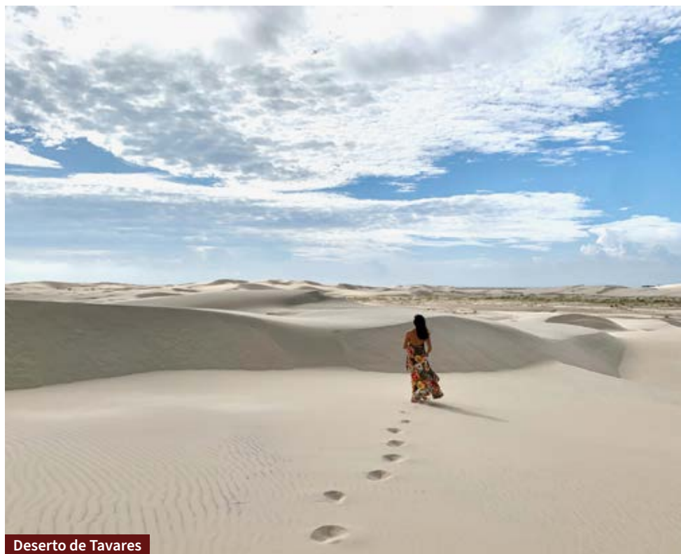
Deserto de Tavares

Também indicamos levar repelente e binóculo para avistar as aves - é fantástico descobrir diferentes espécies na viagem.