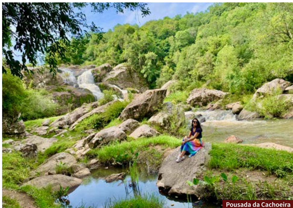
Pousada da Cachoeira

Morro Redondo é um daqueles lugares imersos na natureza. Por isso, indicamos que você leve roupas bem confortáveis e repelente nos passeios. Também não tenha pressa, porque é um destino para você contemplar e se conectar!