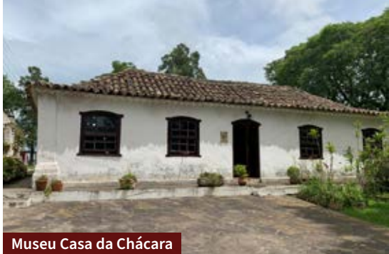
Museu Casa da Chácara

oferece várias opções de pratos à la carte. Tem filés, massas e bifês, servidos sempre com acompanhamento e com muito sabor. Fica na Rua Dr. Monteiro.