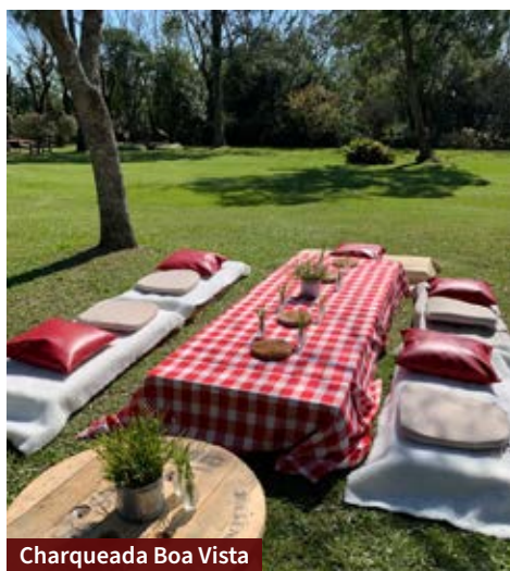
Charqueada Boa Vista

A Santa Rita também tem atividades ao ar livre e espaço na natureza. É possível andar a cavalo, de caiaque ou de canoa, andar de bicicleta, aproveitar a piscina e conhecer o Memorial do Charque.