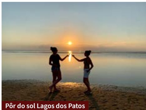
Pôr do sol Lagoa dos Patos