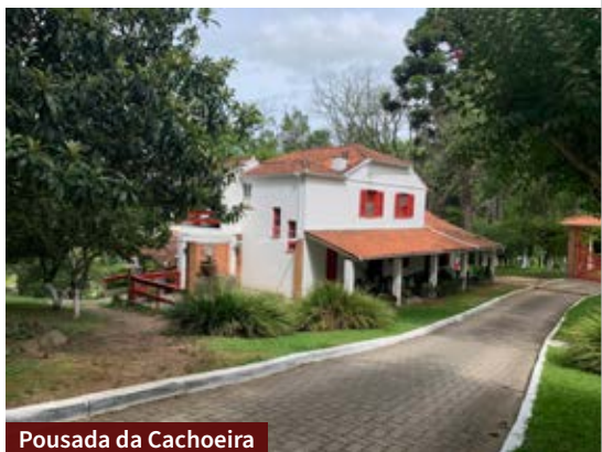
Pousada da Cachoeira