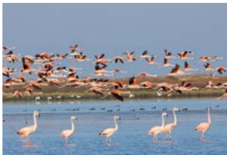
Flamingos na Lagoa do Peixe (Geiser Trivelato)

Pequeno e compacto, o centrinho reúne restaurantes, hotéis e um banco. Além disso, se estiver procurando por informações turísticas, vá ao Centro do Turista, que está localizado na praça central. No centro também há uma igreja que ganha bastante charme com o pôr do sol.