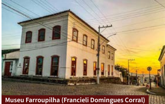
Museu Farroupilha (Francieli Domingues Corral)

diferentes pastéis, pizzas e opções de salgados. Ao meio-dia há buffet a quilo. Fica na Av. Gomes Jardim, 241.