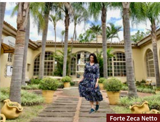
Forte Zeca Netto

› Decorado com objetos antigos, o restaurante La Campaña tem buffet a quilo e livre no almoço, com opções típicas gaúchas e diferentes tipos de carne. Nas quartas, quintas e sextas tem tele de sushi. Fica na Rua Marechal Floriano, 1116.