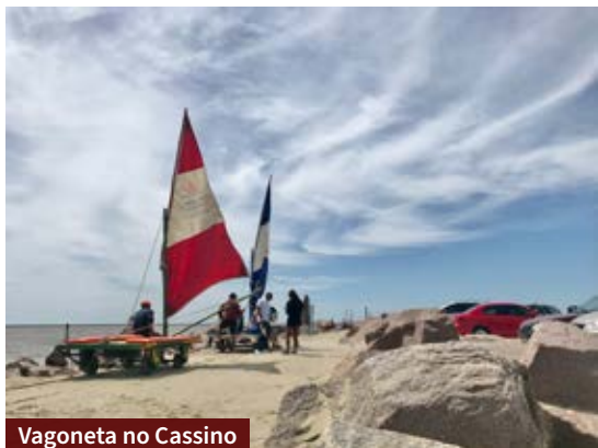
Vagoneta no Cassino

* A visita deve ser agendada pelo e-mail esec.taim.rs@gmail.com ou pelo número (53) 99169-9735, com a Mineia Turismo.