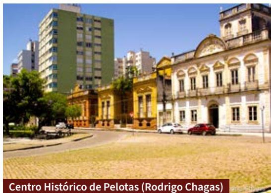
Centro Histórico de Pelotas (Rodrigo Chagas)

A área de Proteção Ambiental dos Botos da Lagoa dos Patos fica na Barra de Rio Grande e ali é possível contemplar botos do Estuário da Lagoa. Por último, tem a Estação Ecológica do Taim, espaço de conservação ambiental entre Santa Vitória do Palmar e Rio Grande e que abriga diferentes espécies de aves e animais. Outro destino interessante é o Chuí, famoso pelo turismo de compras nos free shops .