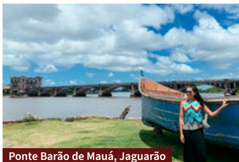
Ponte Barão de Mauá, Jaguarão

Outro lugar que chama atenção é Piratini, que tem roteiro autoguiado que conta a história da Revolução Farroupilha. Em Morro Redondo, os visitantes se conectam com a natureza e percorrem vinícola, cachoeiras e sítios.